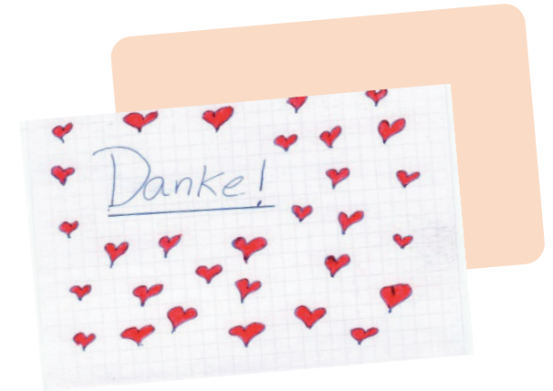
Dankeskarte eines Schülers